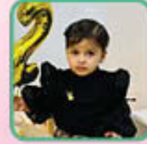
ماسة محمد خراجه