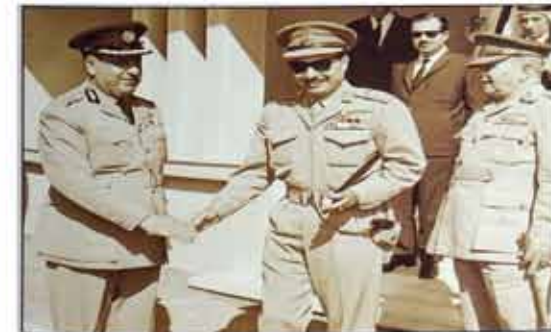
المرحوم الصنبر حابس المجالي لدى زيارته إلى مديرية الأمن العام ١٩٦٤م