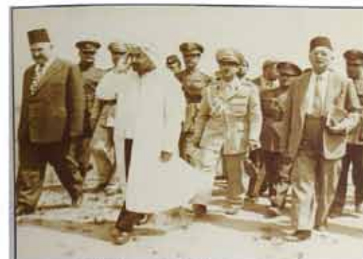
الشهيد الملك عبد الله الاول في إحدى زياراته لإيران

وأذكر مراسم يوم الجمعة والأعياد عندما كان يحضر جلالة الملك الشهيد عبدالله للصلاة في الجامع الحسيني كان جنود المراسم والموسيقى يأتون مشياً على الأقدام إلى باب الجامع عند ذهابهم وإيابهم. وكان الوضع الأمني صعباً لأن أعداداً متنسبي جهاز الأمن