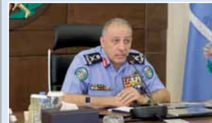
المعاينة ينقل تحيات القائد الأعلى للقوّات المسلّحة لمنتسبي الأمن العام في مختلف الوحدات والتشكيلات