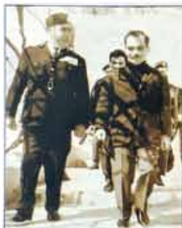
لواء المتقاعد حكمت مهيار مع فريق الأمن العام لفرقة القدس عام ١٩٦٤م

ولا يفوتني أن أشير إلى ما يتمتع به رجل الأمن العام هذا اليوم من كسب الاحترام من المواطنين وهذا إن دل على شيء فإنه يدل على أن جهاز الأمن العام استطاع أن يقرض احترامه على المواطنين من خلال رقي التعاون، والحرص على خدمة المواطن والالتزام بضباطه والحفاظ على حقوقه... وبصفتي من رجال الأمن العام الأوائل ومن ضباطه وقادته أسجل الثناء والشكر والتقدير لمدير الأمن العام وكافة منتسبي الجهاز. تقديراً لجهودهم المتواصلة، وعطاءهم المتميز، حاز على عدد من الأوسمة أثناء خدمته: وسام النهضة من الدرجة الرابعة، ووسام الكوكب الأردني من الدرجة الثالثة، ووسام الخدمة الطويلة المخلصة ووسام النهضة من الدرجة الثانية، ووسام الاستقلال من الدرجة الخامسة، ووسام الاستقلال من الدرجة الرابعة ووسام الكوكب من الدرجة الثانية، ووسام الاستقلال من الدرجة الثانية، ووسام الكوكب الأردني من الطبقة الاولى، ووسام حملتي سوريا والعراق. ووسام الدفاع البريطاني، وذكرى حرب ١٩٤٥-١٩٤٥، ووسام تأسيس البطريركية الارثوذكسية، ووسام صليب الاستحقاق للتعبير المقدس. ووسام الاستحقاق السوري من الدرجة الثانية، ووسام الارز اللبناني درجة ضابط، ووسام الملك للخدمة في سبيل ملك بريطانيا، وغير ذلك من الأوسمة.