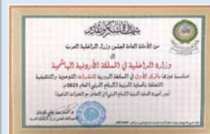
للعام الثاني على التوالي... إعلام الأمن العام يحصد جوائز التوعية العربية