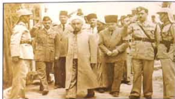
الشهيد الملك عبد الله الاول في يدبة الزرقاء عام ١٩٤٥م

«جندي المشاة» فكان ينتقل سيراً على الأقدام حيث كانوا يحضرون سيراً على الأقدام من الطفيلة إلى عمان. الشرطة والدرك في الماضي عدا عن وظائفهم الأممية كانوا مسؤولين عن حماية الطرق الداخلية والخارجية ويقومون بوظائف حماية الاحراج والسكك الحديدية وتنفيذ كافة المذكرات العدلية. وبالرغم من احوالتي على التقاعد منذ نهاية السبعينات إلا أنني لا زلت أتابع إنجازات هذا الجهاز وما يشهده من تطور في كافة المجالات واستطاع أن أقول أن جهاز الأمن العام في هذا الوقت مفخرة لكل الدول العربية والأجنبية فرجال الأمن العام يتبنون كل يوم انهم على أمد المسؤولية وأن الجريمة مهما تصل إلى مستوى متقدم ومتطور في الاساليب والطرق إلا أنهم الأشاوس يكونون لها ولتفديها بالمرصاد. وحتى الجرائم التي أغلقت ملفاتها نجدهم — تحقيقاً للعدالة وراحة الضمير ورفضاً للباس يعيدون فتحها من جديد لتكشفيها.