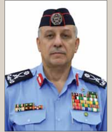
اللواء الدكتور مدير الأمن العام عبيد الله المعاينة

نكتب اليوم عن حاضر سيغدو تاريخاً لأجيال ستأتي من بعدنا، في سطور قرأنا مثلها في تاريخنا، سطور مجد حفرها الأردنيون ملتفين حول لواء هاشمي راسخ في الوجدان، مستقر