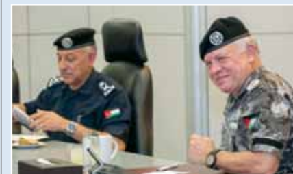
الملك يزور قيادة قوّات الدرك