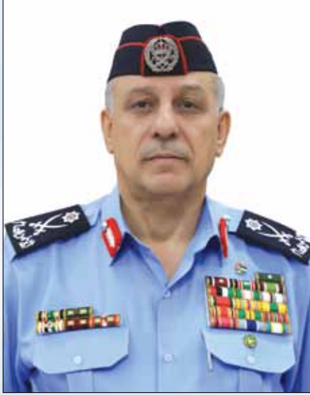
اللواء الدكتور مدير الأمن العام عبيدالله المعاينة

أنفسهم ودماءهم فمنهم من ارتقى لربه راضياً مرضياً ومنهم من ظلّ على العهد والوعد وليكبر الأمل ولنمضي خلف جلالة الملك عبدالله الثاني - حفظه الله- بعزم صادق وإخلاص، متوكلين على الله مجددين العهد والولاء سائلين الله العليّ القدير بأن يحفظ الأردن في ظلّ جلالته وأن يديم على الوطن أسباب التقدّم والازدهار، وكل عام والوطن بخير وأمن وسلام.