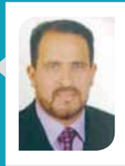
الدكتور سامح محمد الضروس وزارة التربية والتعليم

تمرُّ على الأردنيين في كلِّ عام مناسباتٌ وطنيةٌ عزيزة، فيفرح الجميع باستذكارها وتحفل المؤسساتُ التعليميةُ والحكوميةُ والخاصةُ بها، فتبدأ كلُّ المدارس والجامعات والمعاهد بالاستعداد لإقامة الاحتفالات الكبيرة التي تشهد فرحا غامرا، واعتزازا بالانتماء الوطني للأردن، كما تحتفل المؤسسات العسكرية والمدنية بالأعياد الوطنية، وتقدم أروع النماذج في حب الوطن.