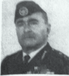
اللواء المتقاعد عزت حسن غندور .