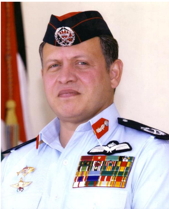
صاحب الجلالة الملك عبدالله الثاني ابن الحسين المعظم