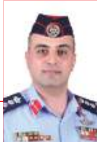
العقيد الدكتور نادر السلاطات مديرية قضاء الأمن العام

لم يعرف المشرع الأردني الجريمة الإلكترونية إدراكاً من أنها ليست من وظائفه وحتى لا يضيق تفسيرها بإيراد تعريف لها، وتاركاً ذلك إلى الأحكام القضائية وإلى شروحات الفقه. وقد تعددت التعريفات الفقهية لها التي يمكن ترجمتها بأنها كل جريمة مقصودة ترتكب بواسطة تقنية أنظمة المعلومات أو عليها.