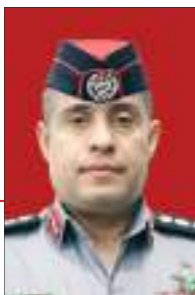
العقيد الركن محمد سليمان الزبيد قيادة قوات الدرك