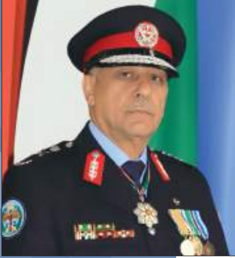
اللواء الدكتور مدير الأمن العام عبيد الله المعايطة

ركيزة في عمل كل مسؤول وكل مؤسسة هو حماية وتعزيز سيادة القانون»