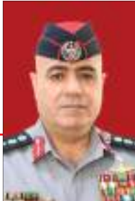
العقيد الركن محمد صالح الصرايرة قيادة قوات الدرك

ومنذ تشكيلها مرت قوّات الدرك بمراحل من التحديث والتطوير، وتم رفدها بأحدث الوسائل، والمعدات والأسلحة، والمهمات نتيجة لاستخدام الإستراتيجيات العلمية الشاملة، التي تقوم على الاستغلال الأمثل للمصادر المتاحة ووضع إستراتيجية لقوّات الدرك التي جاءت استجابة لتوجيهات جلالة القائد الأعلى وتستهدف تطوير الأداء الوظيفي لقوات الدرك وفق أرقى المعايير الدولية، وبشكل تدريجي وانسيابي يحافظ على انتظام الخدمة الأمنية.