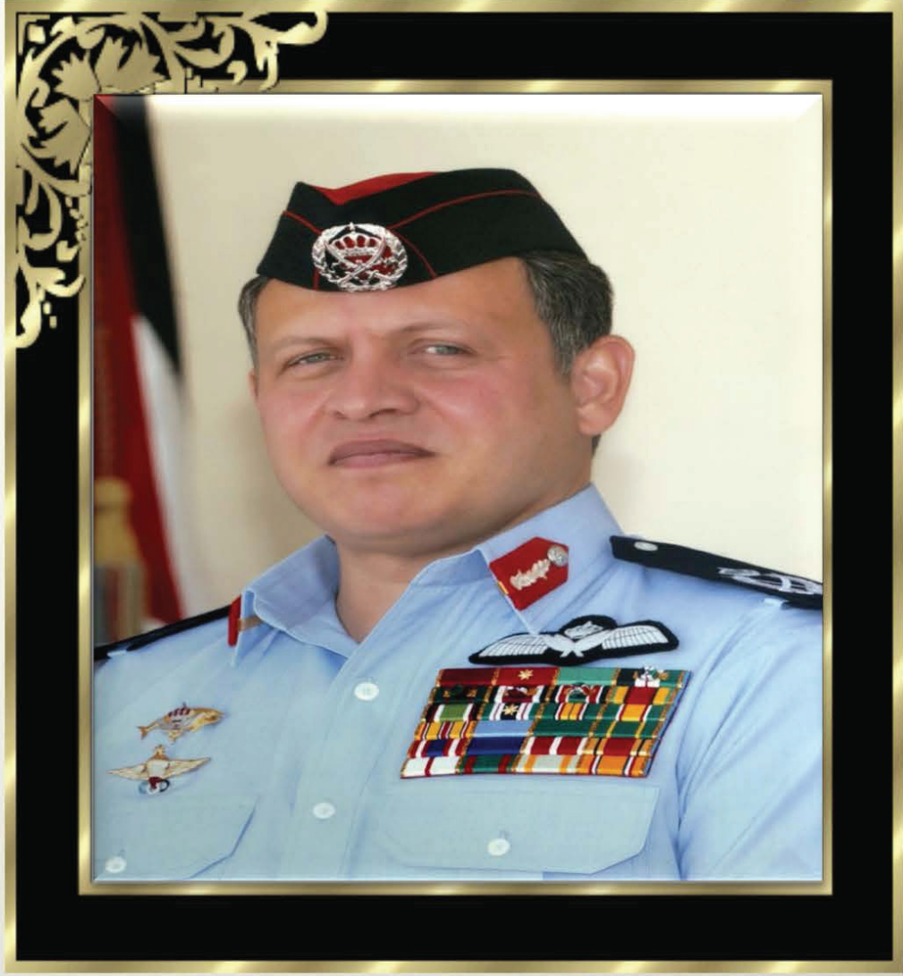
حضرة صاحب الجلالة الهاشمية الملك عبدالله الثاني بن الحسين (حفظه الله)

إن نجاحنا في الماضي قدما على طريق النمو والازدهار والتصدي لقوى الظلام وخوارج العصر لم يتحقق إلا بفضل تماسك وتكاتف الأردنيين والأردنيات.