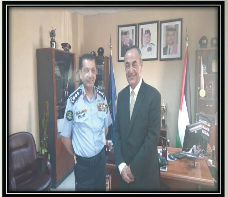
زيارة المجلس الأمني المحلي جويده