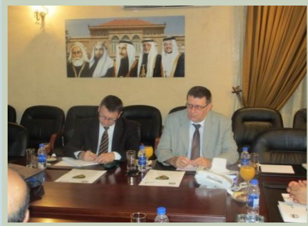
زيارة ممثلين عن الاتحاد الأوروبي للإدارة للتعرف على تجربتها في مجال ضبط الأدوية المقلدة