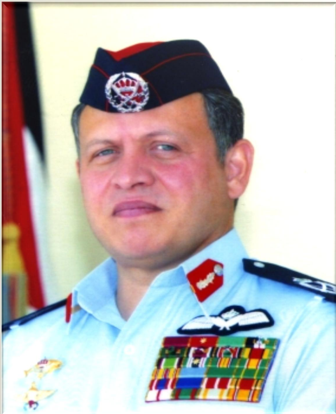
حضرة صاحب الجلالة الملك عبد الله الثاني ابن الحسين - حفظه الله ورعاه -