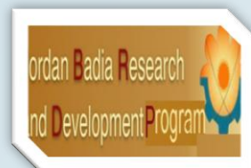
مركز بحوث وتطوير البادية الأردنية