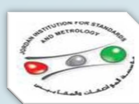
مؤسسة المواصفات والمقاييس