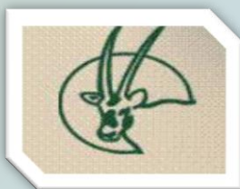
الجمعية الملكية لحماية الطبيعة