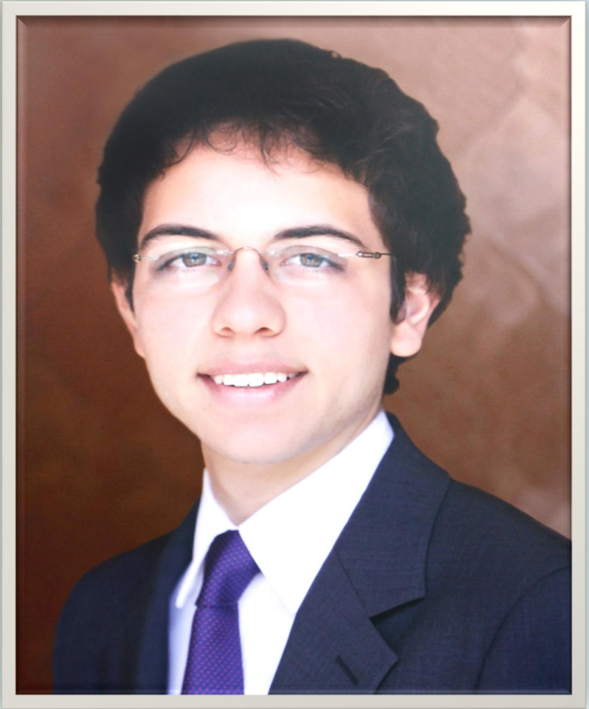
صاحب السمو الملكي الأمير حسين بن عبد الله الثاني ولي العهد