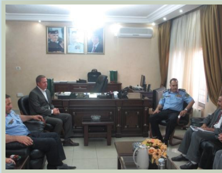
زيارة الخبير الدولي للمواصفة الدولية (ISO 26000) للمسؤولية المجتمعية