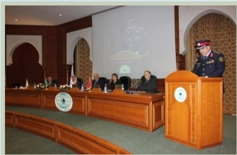
حفل تسلم جائزة المملكة العربية السعودية للإدارة البيئية