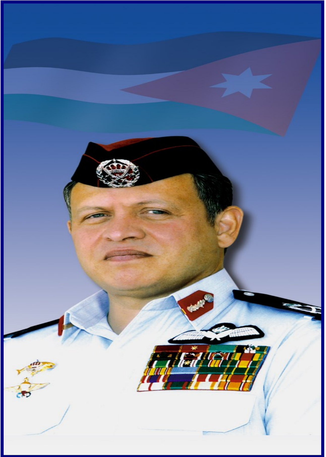
بفضرة صاحب الجلالة الهاشمية الملك عبد الله الثاني ابن الحسين المعظم